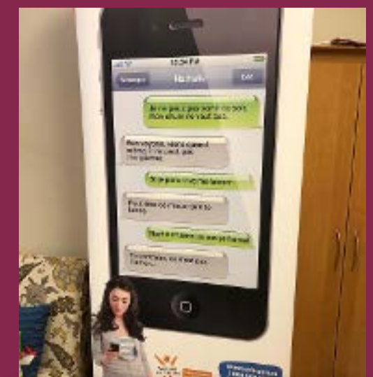
Une des bannières portant un message sur les relations saines.

Des outils produits grâce à une subvention ponctuelle datant de quelques années passées continuent à servir nos besoins pour sensibiliser les jeunes. Trois (3) écoles secondaires de la région de Sudbury ont accepté d'afficher sept (7) bannières illustrées portant des messages sur les relations saines. Nous estimons que quelques centaines de jeunes sont maintenant mieux informés.