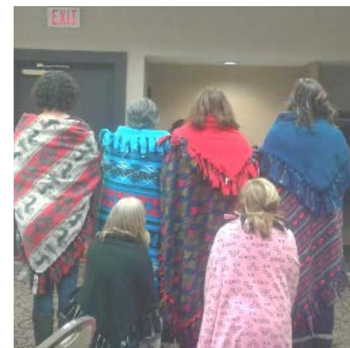
Les couvertures de guérison confectionnées lors de l'atelier éducatif de la Nation des Métis de l'Ontario.