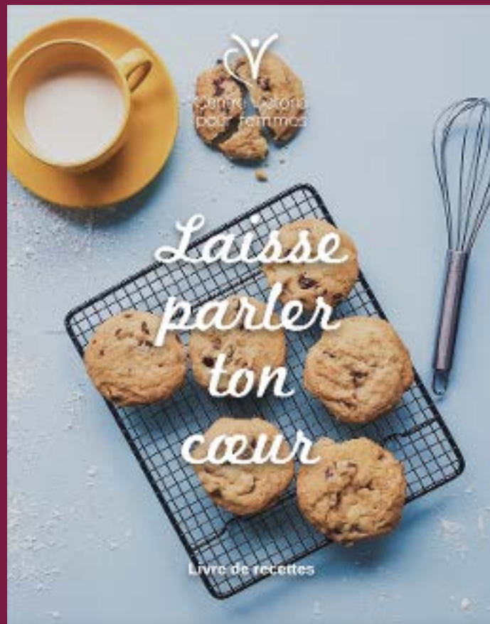
Notre livre de recettes de soin de soi - un grand merci à toutes nos contributrices!

Grâce à un groupe de soutien animé par une intervenante du Centre tôt en 2018, les liens tissés entre les femmes et l'enthousiasme suscité par ce rassemblement ont été tels que le Centre a pu y donner suite en mettant sur pied un autre groupe tout aussi fructueux intitulé « Laisse parler ton cœur ». Ainsi, toutes les intervenantes, l'agente de communication, la superviseure et la directrice ont toutes mis la main à la pâte pour animer une ou plusieurs des séances d'échange, de partage et de projets. Durant le cheminement de ce groupe, les femmes ont contribué à la création d'un livre de leurs recettes avec des rappels d'activités d'auto-soin. Elles ont discuté du bonheur, du féminisme, des fausses croyances et de la colère, et elles ont pu méditer et faire du yoga. « Laisse parler ton cœur » a été offert pendant 23 semaines pour 213 participations des 6 à 18 femmes qui étaient inscrites.