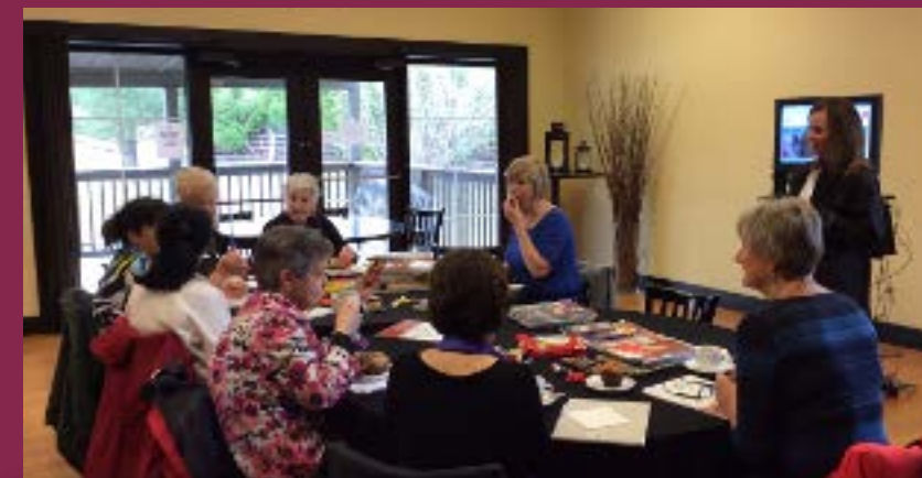
Les femmes de Blind River jasant et bricolent lors d'un café-causerie.